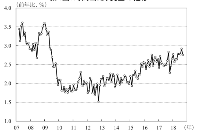
第4図：時間当たり賃金の推移