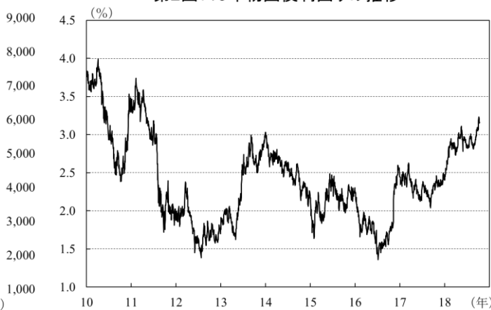
第2図: 10年物国債利回りの推移